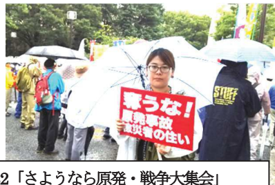
9/22「さようなら原発・戦争大集会」