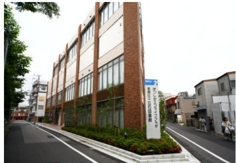
かつしかエコライフプラザ

これまで、「マイナンバー」制度導入に伴い、億単位の税金を一般財源から投入していますが、このようなことこそ区のお金をかける方が区民にとっては有効な税金の使い方ではないでしょうか。